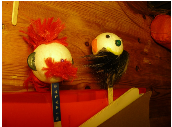
Figure 2: Les tissus à poil